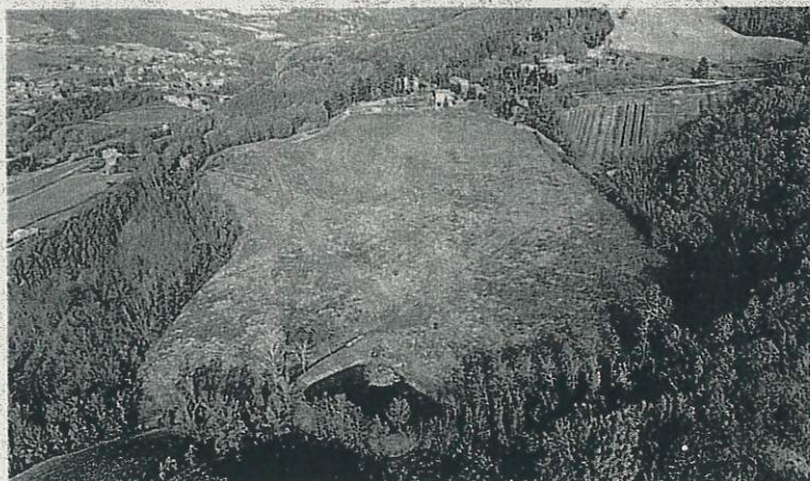
L'area dove dovrebbe sorgere l'impianto fotovoltaico a terra

Domani al Tribunale Amministrativo Regionale dell'Emilia-Romagna si terrà l'udienza di merito relativa al ricorso presentato dai cittadini che contestano l'iter autorizzativo del progetto. Il Comitato ritiene che l'intervento presenti rilevanti criticità tecniche e giuridiche. Tra i principali aspetti oggetto del ricorso figurano la valutazione dell'intervento nel suo complesso, la compatibilità dell'area interessata con la normativa vigente, l'impatto sul paesaggio agricolo e collinare e le procedure espropriative previste per le opere di