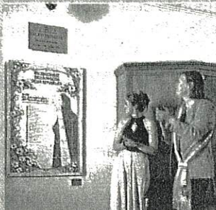
Targa per le Madri Costituenti