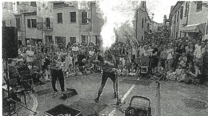
Uno spettacolo di mangiafuoco

Quest'anno, in occasione del bicentenario della nascita di Carlo Collodi, l'intero borgo si lascerà ispirare dal capolavoro "Le avventure di Pinocchio", trasformando il centro in un vero "Paese dei Balocchi". La geografia del divertimento si snoda attraverso cinque aree tematiche principali nel cuore del centro storico. La "Piazza dei balocchi" (piazza Matteotti - Area 1) con le spettacolari installazioni artistiche curate da Manolo Benvenuti (Il Circo di Pinocchio, La Combriccola di Pinocchio con le sue figure monumentali ed Entra nella Fiaba!), oltre a un'area ristoro d'eccellenza con i menù di Osteria Téra, ristorante Il Parco e Valentina Alternative Bake-