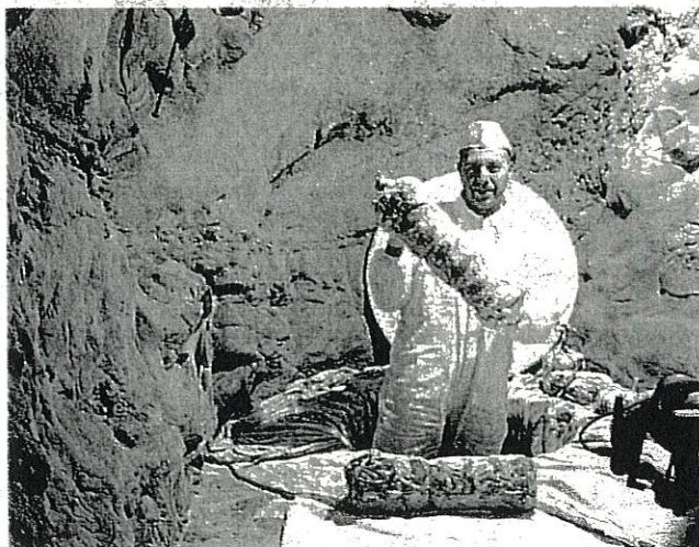
Si è rinnovato ieri il rito della sfossatura

mondiale del formaggio 2025, tenutosi in Svizzera. Grazie a tutti i 5 produttori del centro di Sogliano che sfornano un'eccellenza che tutti ci invidiano. A seguire ci fermiamo in municipio con l'assessore regionale Mammi per ragionare su un consorzio di tutela Fossa dop». «Tra i 44 prodotti dop e Igp della Regione Emilia-Romagna con un giro d'affari di 37 milioni di euro – ha detto Mammi – spicca anche il Fossa. Un grande patrimonio gastronomico, culturale e tradizionale che guarda al futuro e un consorzio del del Fossa dop appare opportuno per valorizzarlo».