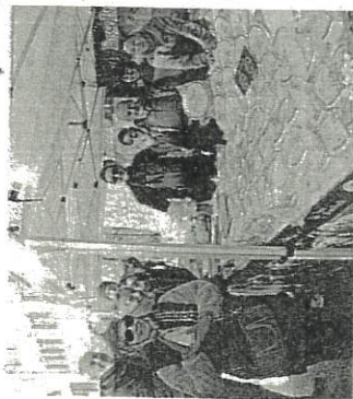
Soddisfatti i titolari delle fosse

oltre al Fossa, anche altri prodotti tipici, come il Savor di Montegelli, il miele, i vini, i salumi, la frutta di stagione. «Non ci aspettavamo così tanta gente - affermano i titolari delle Fosse - una partenza positiva che fa ben sperare anche per le prossime due settimane». Tante visite anche nei vari musei cittadini e molto interesse ha riscosso la mostra nell'ex scuola elementare dell'Associazione Astrofili Vega. Il gruppo celebra 20 anni di attività con la mostra "Dalle Fosse alle Stelle", una mostra astronomica pensata per coinvolgere grandi e piccoli nel mondo dell'astronomia. La