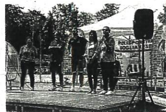
L'evento conclusivo del progetto

"Free to live": inclusione tramite lo sport