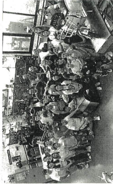
La visita degli studenti al Lambretta centre