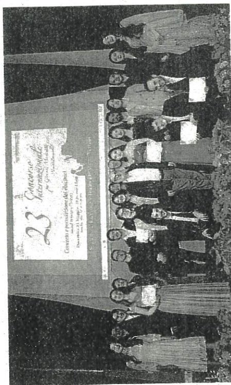
Il gruppo dei premiati al concorso internazionale

Successo per la storica manifestazione dedicata ai giovani talenti della musica. Il 23° concorso nazionale "Luigi Zanuccoli", si è svolto dal 18 al 31 maggio con 250 partecipanti. E' stato organizzato dall'Associazione musicale ClassicAllMusic di Rimini, in collaborazione con il Comune di Sogliano. La commissione ha valutato con attenzione le esibizioni dei candidati e ha assegnato premi, diplomi, borse di studio. La cerimonia conclusiva ha celebrato i vincitori delle diverse categorie, accolti dagli applausi del pubblico. Ecco tutti i premiati, nella categoria solisti Ju-