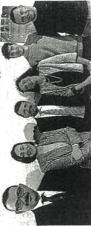
Delegazione da Sogliano al Vinitaly

renza stampa di presentazione dell'edizione 2026 di "Tramonto DiVino", iniziativa sostenuta dalla Regione Emilia-Romagna e dall'Associazione Italiana Sommelier. In questa occasione è stato annunciato che il Fossa dop sarà protagonista in due tappe dell'evento, a Parma e a Riccione, oltre a essere al centro di un abbinamento con