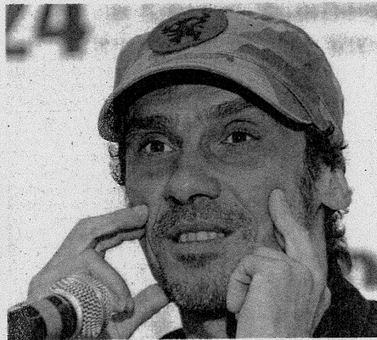
Il musicista francese Manu Chao sarà protagonista dell'ultimo concerto della stagione 2023 di "Soglianosonica"

gine, che raccoglie musicisti di diversa formazione e provenienza. Unendo tanti generi musicali (rap, funk, reggae, etno folk iberico, centroamericano e balcanico) e lingue (francese, inglese, spagnolo e italiano), nasce la "patchanka", neologismo che identifica una musica fatta per ballare e pensare, e dà il titolo al primo album della band, del 1988. Mentre l'atmosfera è danzereccia, allegra e scanzonata, i temi che trattano i testi sono di ivalsa sociale, lotta alla discriminazione e critica politica.